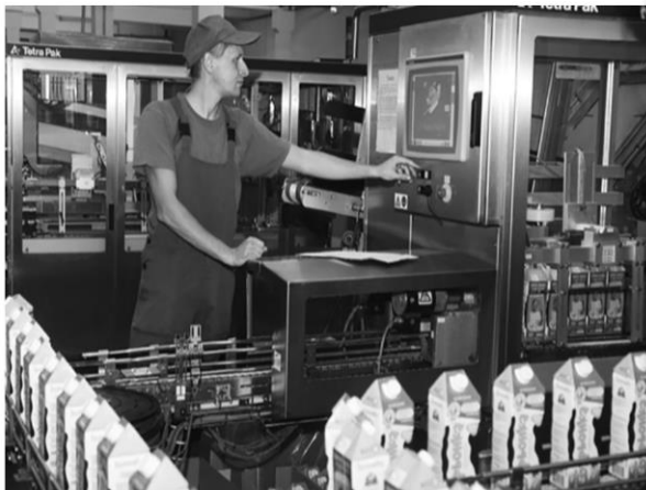
Пастеризація молока на одному із заводів компанії «Люстдорф»

Виробництвом молочної продукції в Україні займаються більше 300 підприємств, майже 80% ринку контролює 50 заводів, значна частина яких входить до складу великих холдингів.