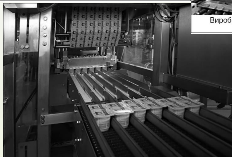
Лінія з фасування йогуртів торгової марки «Тьома» заводу «Данон Дніпро»