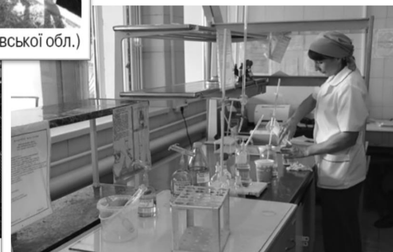
У лабораторії Чернігівського молокозаводу компанії «Milkiland Україна»