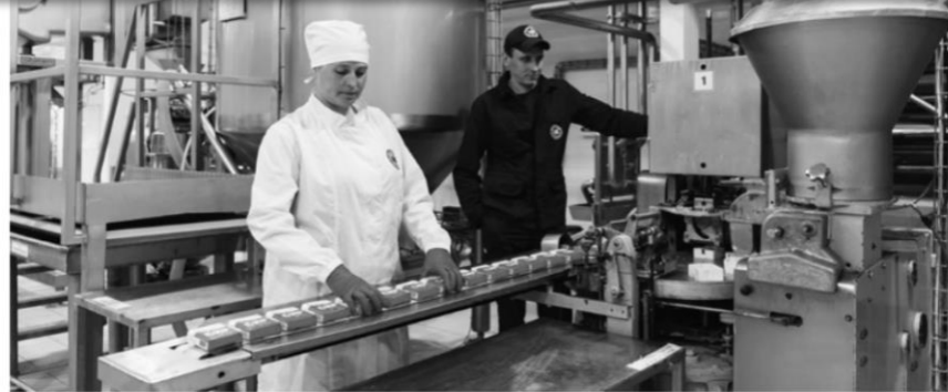
Цех з виробництва масла на Яготинському заводі групи «Молочний Альянс»