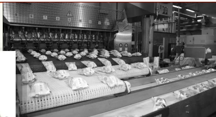
Виробництво морозива на ПАТ «Житомирський маслозавод»