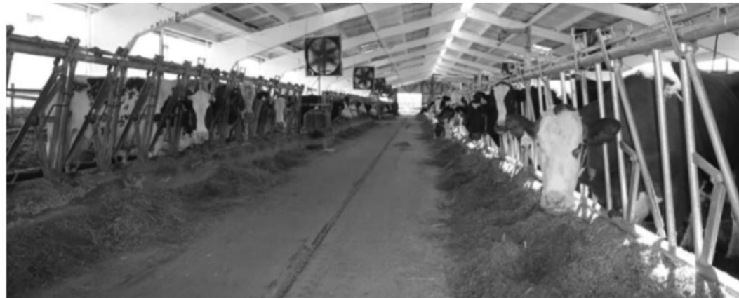
Молочна ферма підпр-ва «Пісківське» (Бахмацький р-н Чернігівської обл.)