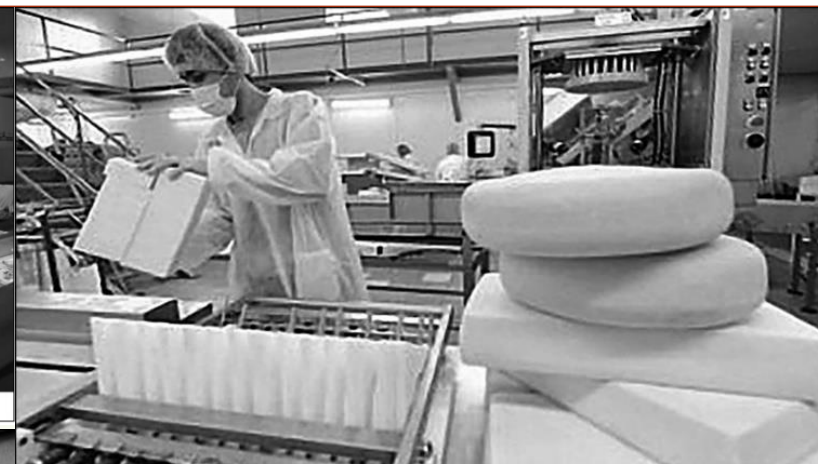
Виробництво сирів на заводі «Дубномолоко» (Рівненська обл.) компанії «Комо»