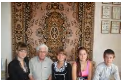
У гостях у ветерана

22 вересня 2011 року студентська рада технікуму провела соціальну акцію