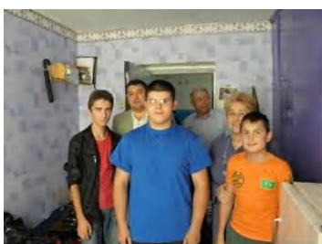
Та й хлопці «не пасуть задніх»

здобутками у покращенні соціально-побутових умов для проживання студентів у гуртожитку. Було оголошено конкурс «Краща студентська кімната (блок) гуртожитків Полтавського технікуму харчових технологій Національного університету харчових технологій». Кожен поверх та блок гуртожитку чепурився до цієї події. Було визначено об'єм робіт, обрховано видатки, забезпечено матеріалами та здійснено косметичний ремонт