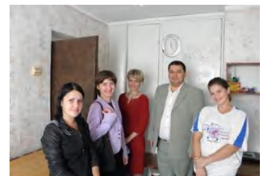
Краща кімната дівчат