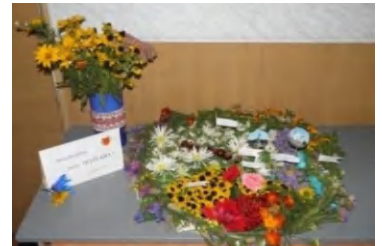
У кожній квіточці – любов до рідного міста. Роботи переможців.

23 вересня 2011 року у місті Полтаві проходили урочисті заходи у рамках святкування 68-ї річниці визволення Полтави від фашистських загарбників та Дня міста. Активісти студентської ради технікуму на чолі з головою студради взяли участь у покладанні квітів до Меморіального комплексу солдатської слави та ушанували пам'ять загиблих.