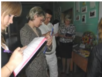
Непроста робота журі

21 вересня 2011 року відбувся традиційний конкурс квіткових композицій, якого з нетерпінням усі чекали. Тема цього річного конкурсу – «Рідне місто моє, я кохаю тебе». У ньому